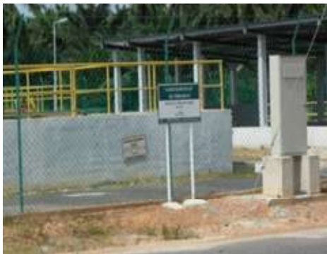
Loji Rawatan Kumbahan

Pengecualian ini adalah bagi pemajuan bangunan utiliti seperti bangunan Pencawang Masuk Utama (PMU), Pencawang Pembahagi Utama (PPU), Substation Utama (SSU), Pencawang Elektrik (PE), “Permanent Telecommunication Exchange”, Loji Rawatan Kumbahan, rumah pam dan tangki air.