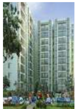
Contoh bangunan harta bersama dalam perumahan strata