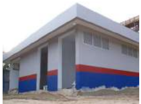
Substation Utama (SSU)