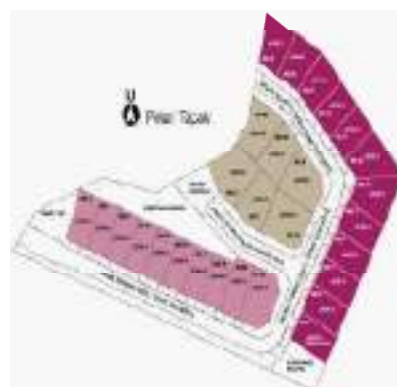
Contoh pelan susun atur kawasan perindustrian